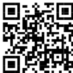
แนวทางการคัดสรร ฯ 2569

**แนวทางการการคัดสรรกิจกรรมพัฒนาชุมชนดีเด่น ประจำปี ๒๕๖๙ แนวทางฯ ตาม QR-Code